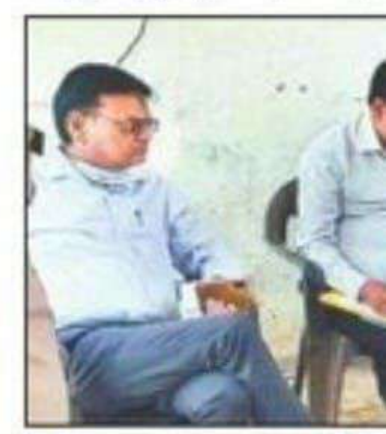
एटा में शनिवार को र

एटा। कोतवाली देह पंचायत पवांस में 🔅 बनियानधारी गिरोह ने इसका खुलासा शनिव की ओर से लिए गए घ हआ है। जांच समिति निरीक्षण किया। एक ग काटने की बात भी सा ग्राम पंचायत पवांस बनी गोशाला पहुंच एएसडीएम वेदप्रिय अ चिकित्साधिकारी डॉ. 3 घायलों के बयान लिए कि गोकशी करने वालों रही थी। सभी लोग व पहने हुए थे। जबकि र व्यक्ति पूरे कपड़े पह